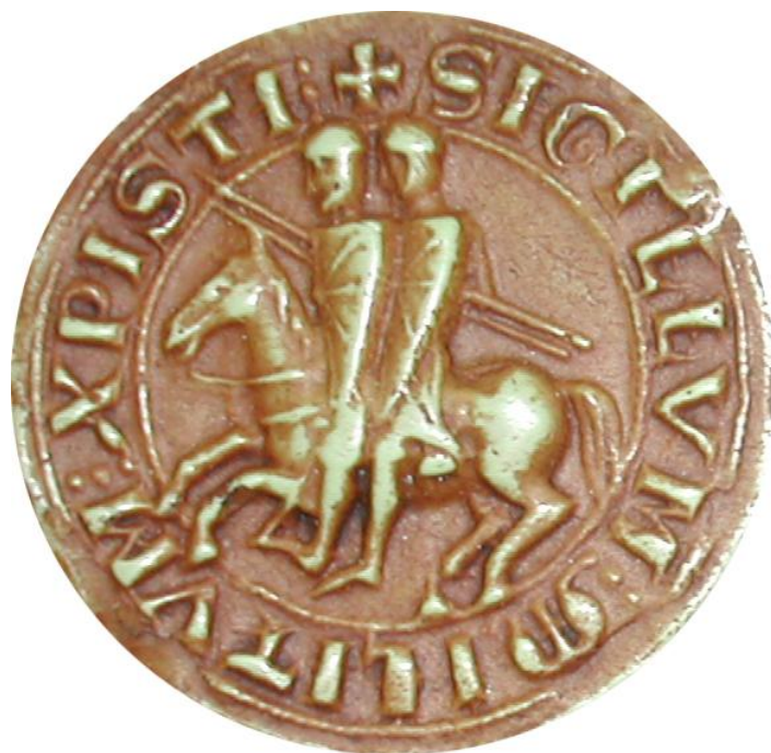
SIGILLUM .MILITUM.XPISTI 1259, 33 mm - AN, sc/D 9863