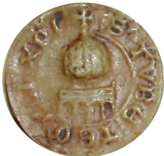
Le « Dôme du rocher » - AN, sc/D 9862 + S' : TVBE : TEMPLI : XPI (Christi)