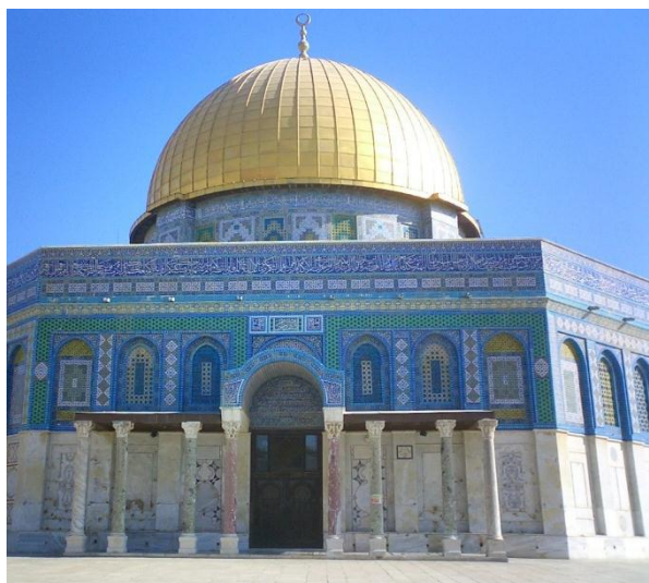
Le « Dôme du rocher ».

Un autre sceau de Maître (début XIII e siècle) évoque le lieu d'installation des Templiers à Jérusalem, expliquant par ailleurs le nom même de l'ordre. La mosquée d'Al-Aqsa, est située au sud de l'esplanade du Temple de Jérusalem, au sud duquel le roi Salomon avait bâti son palais.