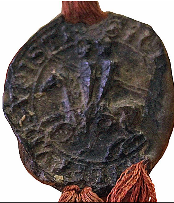
AN, J 1988, n° 100, sceau de Renaud de Vichier, maître de l'ordre du Temple, en cire verte, 1255, 33 mm.