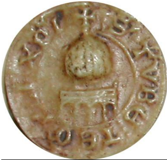
Le « Dôme du rocher » - AN, sc/D 9862 + S' : TVBE : TEMPLI : XPI (Christi)