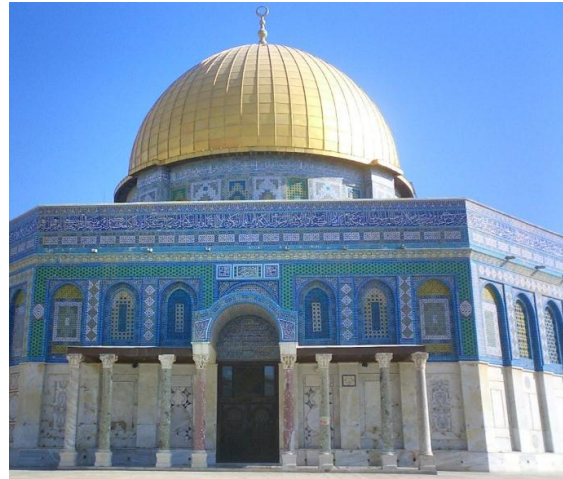
Le « Dôme du rocher », Photo de Nathalie Privé.

Un autre sceau du Maître de l'ordre du début XIII e siècle représente avec plus de précision le monument à coupole, ou dôme.