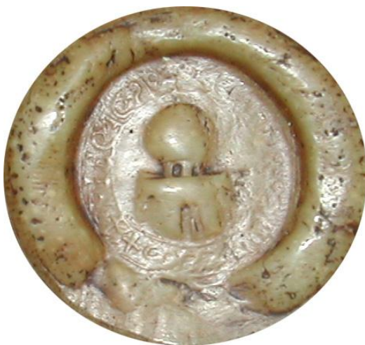
AN, sc/D 9858 + S' : TVBE : TEMPLI : XPI

Le moulage en plâtre du sceau nous permet de mieux voir les détails.