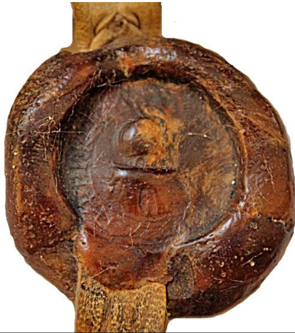
Le « Dôme du rocher » - AN, S 2155, n° 18 + S' : TVBE : TEMPLI : XPI